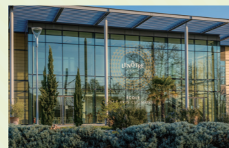
École Lenôtre in Paris, France 【日本唯一的姐妹校】

“食与职业的学校”田中教育集团，50多年来一直在烹饪、糕点、高等专科学校、商务等领域运营学校。以烹饪、糕点行业为主，每年培养出优秀的人才，以高就业率为豪。是拥有悠久历史和优秀实绩的教育集团。