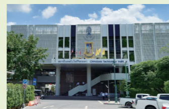
Thai Land Royal Comprehensive School, Chitralada Technology Institute (CDTI) 【日本最初的姐妹校】