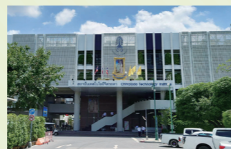
Thai Land Royal Comprehensive School, Chitralada Technology Institute (CDTI) [Trường hợp tác quốc tế đầu tiên ở Nhật Bản]