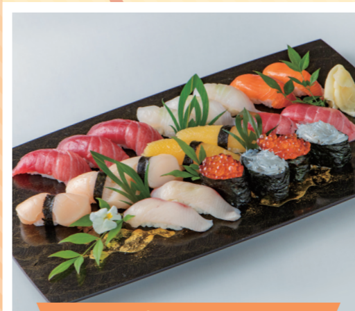
Đầu bếp, Người nấu ăn

厚生労働大臣指定 国家試験免除校 / 文部科学大臣認定 職業実践専門課程 西東京調理師専門学校