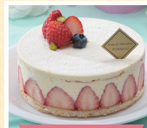
Đầu bếp bánh ngọt, Tiệm bánh mì

学校法人 啓倫学園 厚生労働大臣指定 製菓衛生師・調理師養成校 国際製菓専門学校 文部科学大臣認定 職業実践専門課程